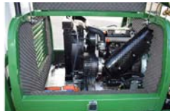
Motor Diesel 27cv