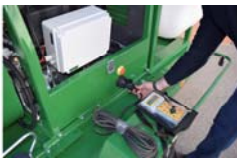
Panel control a distancia