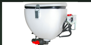
Mezclador de producto