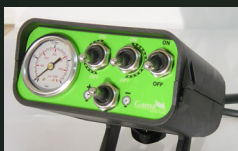
Mando eléctrico + regulación presión en cabina