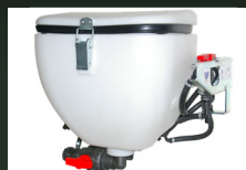
Mezclador de producto