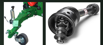
Timón giratorio + Transmisión homocinética