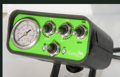
Mando eléctrico + presión en cabina