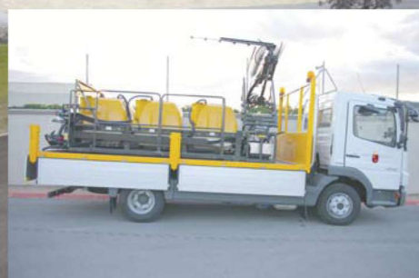
el aplicador más productivo