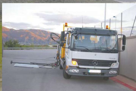
4 funciones hidráulicas de barra

el aplicador fitosanitario diseñado para la carretera