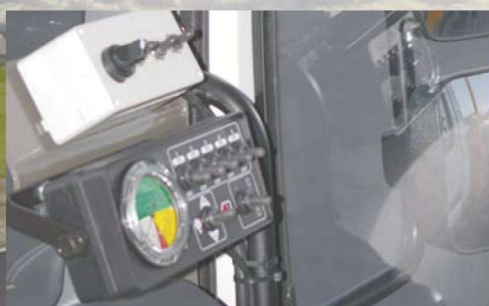
mando desde cabina