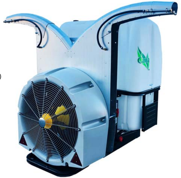
ALCANCE Ø800 Ø900