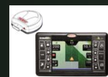
Computadora ARAG BRAVO-400s LT 7-vías con antena GPS