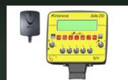
Computadora KRONOS 5-vías con antena GPS