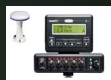
Computadora ARAG BRAVO-180s 7-vías con antena GPS