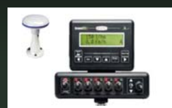
Computadora ARAG BRAVO-180s 5-vías