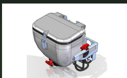
Mezclador de producto 35L multifuncion