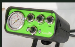
Mando eléctrico 2 botones + presión en cabina