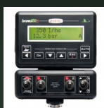
Bravo-180 2-vías Dosificación automática