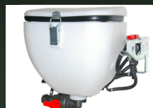
Mezclador de producto