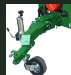
Timón giratorio + Transmisión homocinética